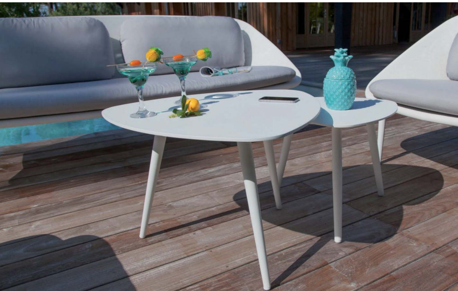
Table basse Phoenix Océo Star du salon de jardin