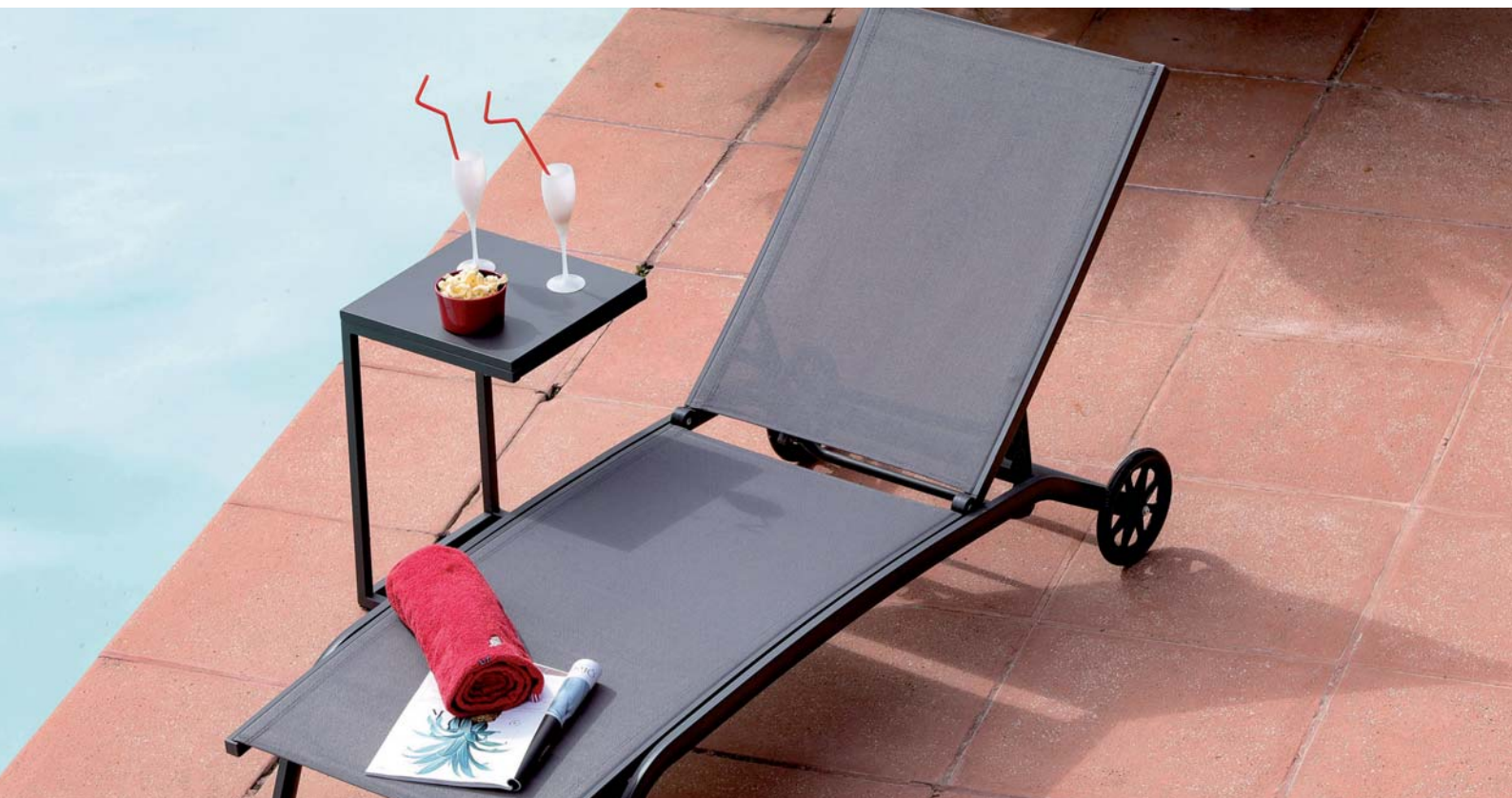
Table basse Violette Alizé Enfin un endroit où poser son verre !

Avoir son verre à portée de main, près du transat, du fauteuil ou du canapé, voilà un « luxe » que permet la table basse Violette Alizé, petite et serviable à souhait, car positionnable en angle partout où l'on a besoin d'elle.