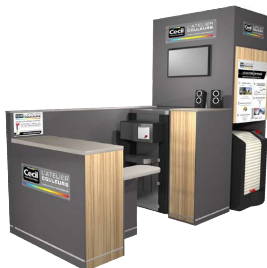
Atelier Couleurs Expert Arche