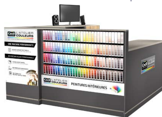
Atelier Couleurs Expert Cube